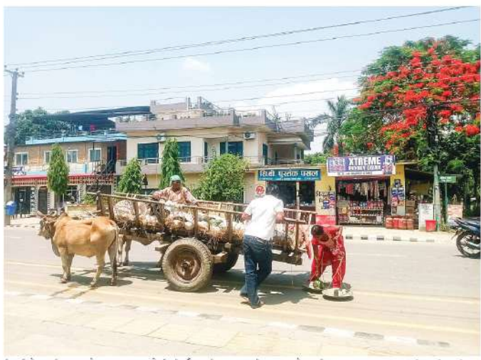
कैलासीको धनगढी बजारमा गौमाछाट्याय तरबुजा लोभ विचो गई धनगढी उपमहानगरपालिका- १२ खुलेडाका किसान ।