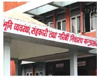
भूमि व्यवस्था, सहकारी तथा गरिबी निवारण मन्त्रालय

भुजम शर्मा काठमाडौं, वैशाख २२ सकल मालपोत कार्यालयको नाम परिवर्तन गरी 'भूमि प्रशासन कार्यालय' राखेको छ । राष्ट्रिय मालपोत कार्यालयको नाम परिवर्तन गरी 'भूमि प्रशासन कार्यालय' राखेको छ ।